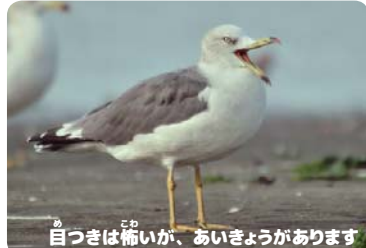
自つきは怖い、あいきょうがあります

なつ さんばん ぜ 夏になると三番瀬にたくさんやってくるウミネコ。 「ミーオ」と猫のような声で鳴くことからこの な つ に ほん ふつうしゅ ぜ 名が付きました。日本では普通種ですが、世 界的には珍しい野鳥です。(大谷)