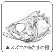
▲ススキのあたまの骨