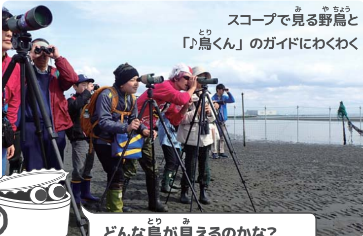
スコープで見る野鳥と 「♪鳥くん」のガイドにわくわく

さんばん ぜ かんきょうがくしゅうかん みりょく し せつ わたし おも さいだい みりょく ふなばし三番瀬環境学習館はとっても魅力あふれる施設です! 私が思う最大の魅力は、なんといっ さんばん ぜ ひ がた ちか ひ がた と ほ ぶん ちょうちょうこうりつ ち こんかい がくしゅうかん も三番瀬干潟がすぐ近くにあること。干潟まで徒歩 1 分という、超々好立地です。今回は、学習館が ひ がた はま べ まいつきおこな さんばん ぜ たんけんたい しょうかい 干潟や浜辺で毎月行っているワークショップ、「三番瀬探検隊」についてご紹介します。