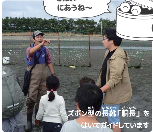
ズボン型の長靴「胴長」を はいてガイドしています