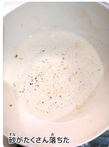
すな 砂がたくさん落ちた