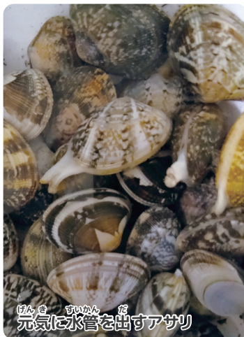
げんき すいかん 元気に水管を出すアサリ