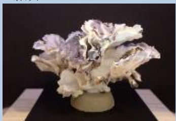
マガキがくつついて出来るカキ礁は小さな生きものすみか