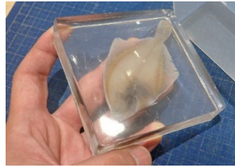
360°好きな角度から観察できる 樹脂封入標本 ※実際の封入物とは異なります

くっついていく様子がわかる動画やくっつく部位をじっくり観察できる標本がございます。