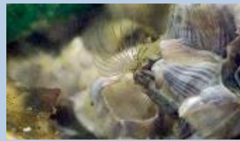
フジツボがプランクトンを食べている様子

意外と詳しい生態を知らない「フジツボ」や「イソギンチャク」などの効率的な摂餌方法の紹介