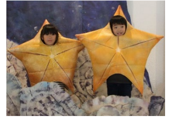
生きものになりきる子どもたち ※過去の特別展の様子